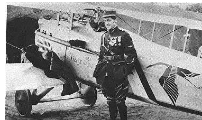
George Guynemer posant devant son Spad VII

L'as des As français, le Capitaine Georges Guynemer n'est pas rentré de sa mission le 11 Septembre 1917 dans le ciel de Poelcapelle, pas loin de Gersburg. Toutes les inquiétudes sont permises maintenant puisque ni son avion, ni sa dépouille n'ont pu être retrouvées à l'heure qu'il est. Notre plus grand héros semble tombé en pleine gloire, nous laisserait orphelin d'une icône dont la nation a besoin.